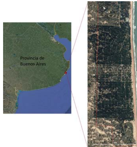
Figura 1. Área de estudio de arbolado en dunas costeras bonaerenses.

La zona se encuentra dentro de la región pampeana con predominio del turismo urbano costero como dinamizador de la economía local (1).