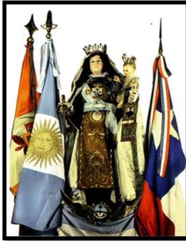
Figura 2: La Virgen del Carmen . Patrona de los Ejércitos de los Andes.