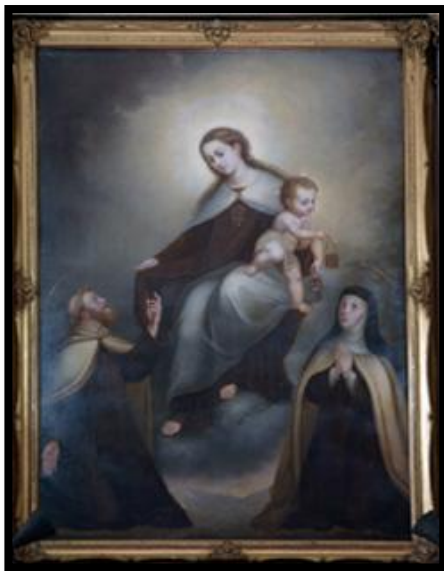
Figura 1: La Virgen del Monte Carmelo