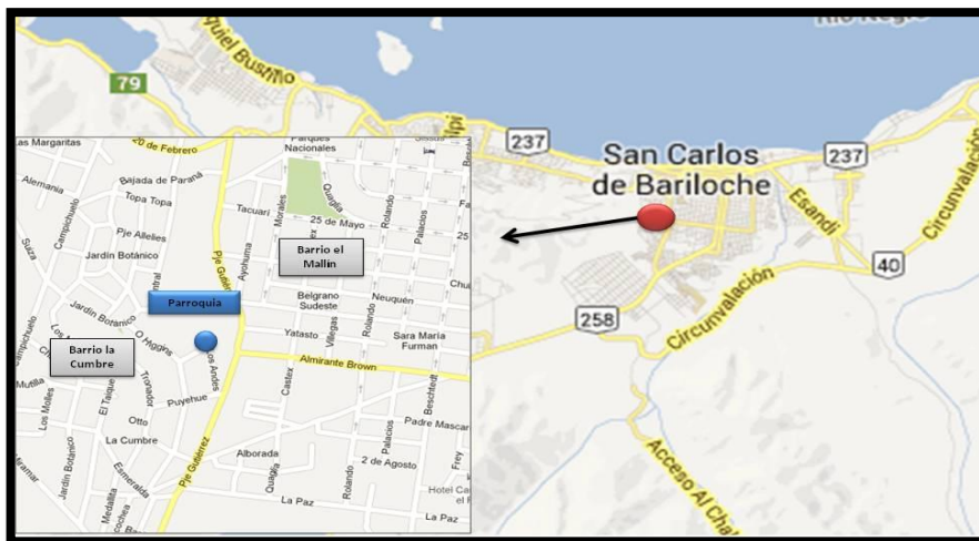
Mapa 1: Localización de la Capilla Nuestra Señora del Carmen y los Barrios La Cumbre y El Mallín

identitaria barrial y a la devoción mariana carmelitana como parte fundamental de dicho proceso. Para luego, visualizar cómo el traslado y la práctica devocional carmelitana de los chilenos en San Carlos de Bariloche puede ser leída como estrategia de integración en respuesta a un proceso de desarrollo social que, debido a los contextos políticos autoritarios, se tornó cada vez más excluyente. En función de ello, el artículo se organiza en tres partes: una primera parte introductoria a la temática, en donde se desarrollan las características de la migración chilena en la ciudad junto con el proceso de organización y puesta en funcionamiento de la capilla Nuestra Señora del Carmen en el barrio de los chilenos ; una segunda parte, dedicada especialmente a la Virgen del Carmen en donde se analiza el origen de la advocación en Chile y su traslado a San Carlos de Bariloche; para finalmente abordar a la devoción mariana del Carmen y el proceso de conformación de la capilla como espacio sagrado de pertenencia chilena y a la práctica devocional como estrategia de integración.