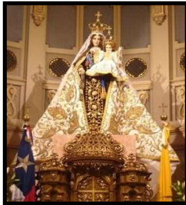
Figura 3: La Virgen del Carmen Madre, Reina y Patrona de Chile