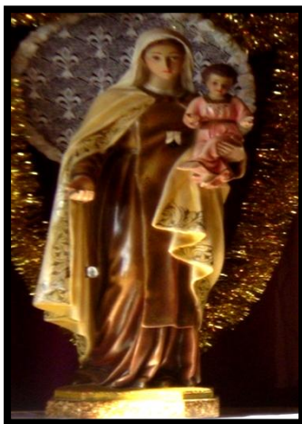
Figura 4: La Virgen del Carmen , entronizada en la Capilla (1972)