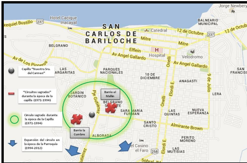
Mapa 2: Círculo Sagrado de la Capilla/Parroquia de Nuestra Señora del Carmen.