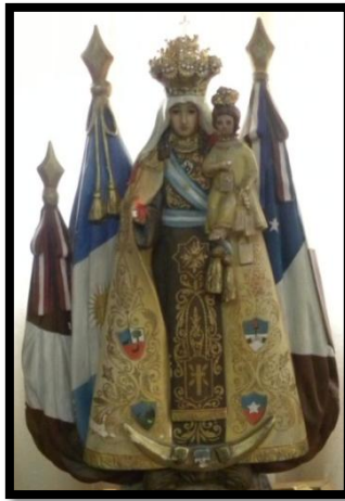
Figura 5: La Virgen del Carmen . Patrona de los Ejércitos de los Andes.

El sentido de pertenencia también se reforzó a través de otra imagen de la misma advocación, La Virgen de la Independencia bajo el patronazgo del Ejército de los Andes (Figura 5). La misma era utilizada por los fieles en las procesiones y festejos del 18 de septiembre, día de la Independencia chilena.