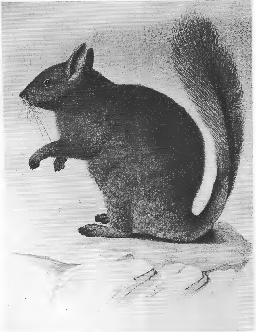
Figura 149. Vizcacha de la sierra o Pilquiñ . Dibujo del Atlas de C. GAY, Paris 1849.