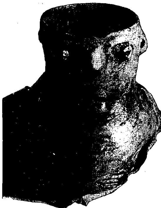
Fig. 1. - Cántaro de Estancia "Tres Picos". - (Foto Bachmann).

El primer comentario que surge para esta pieza, es de que no es de ningún modo araucana. Ni en nuestro estudio preliminar de la cerámica del Neuquén (Schobinger, 1957, p. 151 y ss.), ni en la bibliografía o en la visita a museos de Chile recordamos haber visto algún cántaro semejante. En cambio, los hay en un área —y en una cronología— muy alejada: la cultura de La Candelaria, cuyo centro se halla, como se sabe,