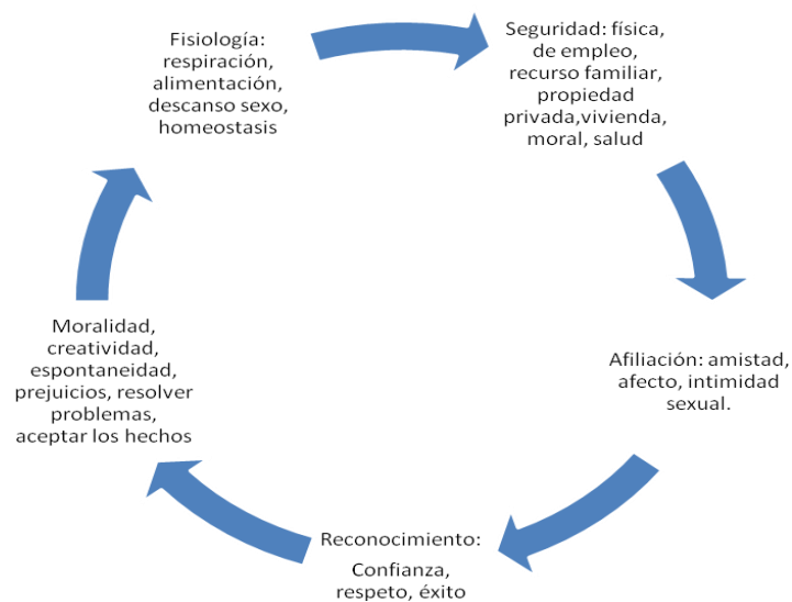
Grafico 1 sobre las necesidades básicas

Nota: Construido desde los aportes de Abraham Maslow, libro “teorías de las necesidades” (1987).