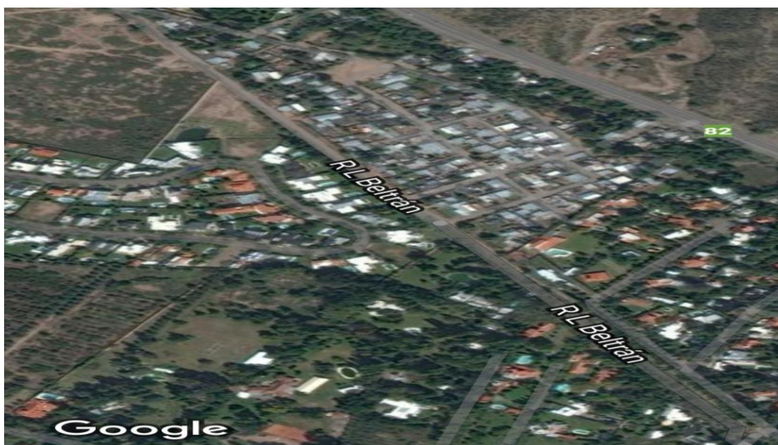
Figura n°1- Mapa satelital