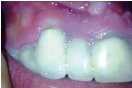
Figura 14: Tejidos periodontales con recuperación de salud.

tores etiológicos en ocasiones no se pueden determinar con precisión, muchos de los tratamientos se realizan en función de la prevención o del alivio de los síntomas durante la terapia endodóntica. Esto conduce a que no se proponga un tratamiento específico aceptado universalmente.