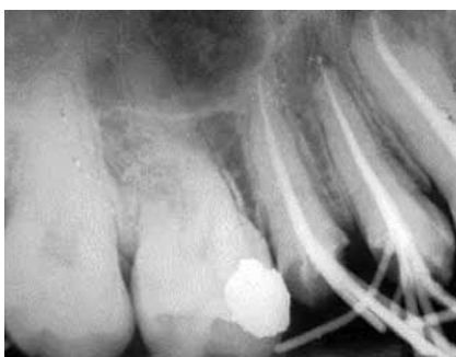
Figura 6: Radiografía pre final en donde se observa sobreobtención de 0.5 mm en elemento 14 y en el elemento 15 obturación del conducto con una correcta condensación.

ra se realiza con fresa redonda N° 2, preparación de acceso con limas pre-RaCe® (FKG Dentaire, Suiza) .10 y .08, se establecieron longitudes de trabajo a 18 mm en ambos conductos, se procedió a la instrumentación mecanizada del conducto, con limas Wave One (Dentsply, Brasil) #25/.08 con irrigación de hipoclorito de sodio al 5.25% durante el todo el procedimiento.