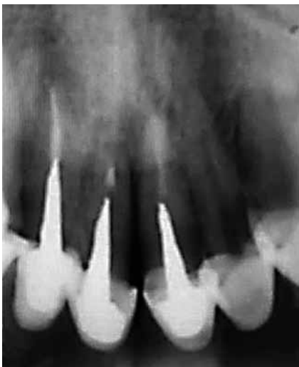
Figura 16: Radiografía de Control a los 4 meses. Se observa la rehabilitación de los elementos dentarios.

De hecho, plantean que el dolor puede aliviarse mediante la administración de placebos. Actúan ali-