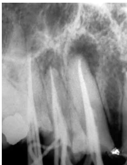
Figura 5: Radiografía pre final, en donde se observa el elemento 13 obturado a 1 mm del ápice.

los procedimientos a realizar, se obtuvo el consentimiento informado por parte del paciente.