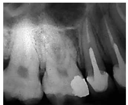
Figura 18: Radiografía de control a los 4 meses, se observa rehabilitación de los elementos 14 y 15.