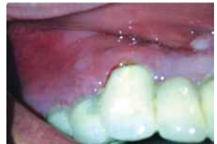
Figura 11: Fistula en el elemento 14 por el cual drenó el absceso.

notoria de la zona facial y leve infla (Fig.12) A los 6 días de realizado el tratamiento endodóntico, luego de 72hs de terapéutica antibiótica, se observó una evolución satisfactoria, ya que no se observaban signos de inflamación facial. (Fig.13) De la misma manera en la zona intraoral afectada se puede notar como los tejidos recuperaron la salud. (Fig.14)