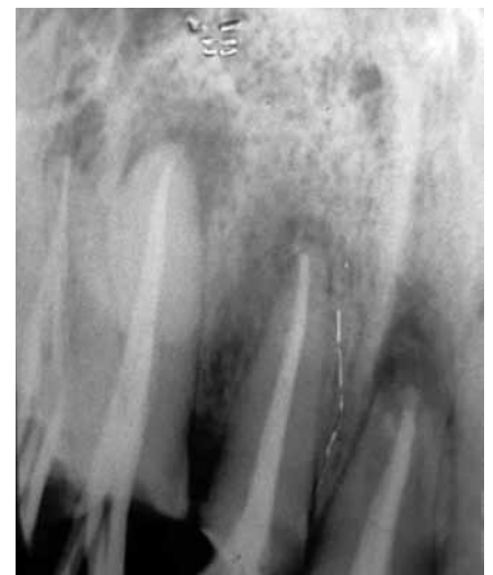
Figura 4: Radiografía pre final, en donde se observan los elementos 11 y 12

realización del tratamiento endodóntico (14). El hidróxido de calcio es utilizado como medicación intracanal con diversos fines, utilizado medicación intracanal no es útil para prevenir o reducir el dolor postoperatorio. Se estudio la tasa de reagudizaciones cuando se utilizaron antibióticos previos al tratamiento y no encontraron ninguna diferencia con respecto a pacientes que no fueron medicados previo a la intervención endodóntica.