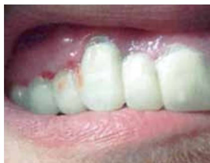
Figura 7: Adaptación provisoria del puente.

En el elemento 11 se utilizó un cono #70/.02 como cono maestro, y para el elemento 13 uno #50/.02 para el elemento 12 se calibró un cono #40/.04, para los elementos 14 y 15 se seleccionaron conos #25/.04, (DiaDent Group International Inc. CANADA & USA) Una vez seleccionados los conos se llevó cemento sellador Sealapex (Sybron / Kerr. EE.UU) con lentulo (VDW, GmbH, München) calibre 25 y se realizó una obturación convencional mediante condensación lateral utilizando conos accesorios MF, F y FM (Dia Dent Group International Inc. CANADA & USA) Debido a que el paciente regresaba a su país de origen se realizaron todos