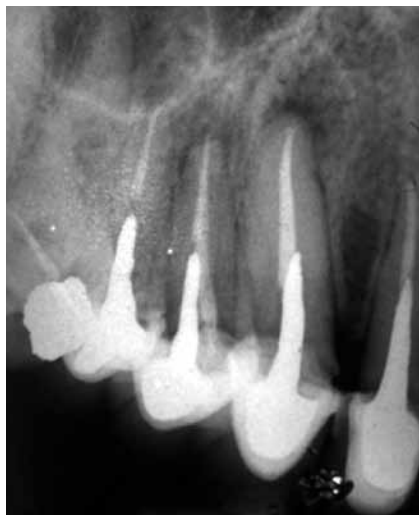
Figura 17: Radiografía de control a los 4 meses, en donde se observa una disminución de la radiolucidez apical en zona del canino.