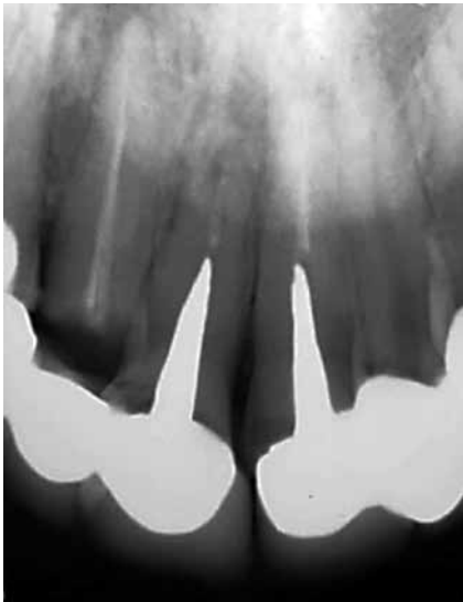
Figura 1: Radiografía preoperatoria en donde se observan los elementos 11 y 12.