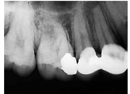
Figura 3: Radiografía preoperatoria en donde se observa el elemento 14 y 15.